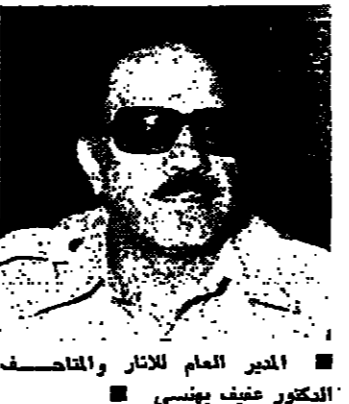
الدكتور عفيف البهنسي

أعلن الدكتور عفيف البهنسي العام للآثار والمتاحف في سوريا ان الدولة جادة في تنفيذ برنامج علمي لترجيح ما اكتشف من آثار مدينة ابيلا وخاصة الرمز التي عثر عليها في القصر الملكي والتي يزيد عددها عن خمسة عشر الف رقيم بتل موضوعية وإمالة. وأضاف يقول في محاضرة القاها مؤخرا في المركز الثقافي العربي بعنوان « ابيلا والتوراة » اننا نستعمل على نشر هذا الكثر الذي يعد دراسته بلمعان من قبل لجنة من كبار المختصين ونشره تباعاً ضمن نطاق اسبوع علمي، لكي يطلع العالم على اسرار التاريخ القديم التي تغر بطن بلادنا كالتسوية ومخزونه.